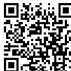
QR Code ADVANCE

Telefone: +55-11-99003-2554 Email: advance@advanceconsulting.com.br Web-site: www.advanceconsulting.com.br